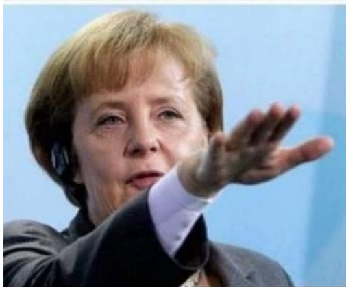
Chancellor Angela Merkel announced that her country will send 500 new troops to A.